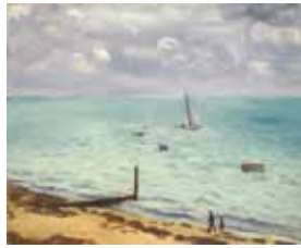
アルベール・マルケ (ル・ピラの浜辺(アルカシオン湾の帆船)) 1935年、パリ、個人蔵 (協力: バリ、ギャラリー・ド・ラ・プレジダンス)

三重県津市大谷町11 TEL059-227-2100 FAX059-223-0570 開館時間: 9:30~17:00(入場16:30まで) 休館日: 毎週月曜日(祝日の場合翌平日)