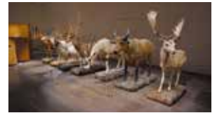
世界屈指の動物標本「ヨシモトコレクション」

観覧料: 一般 700(560)円、学生 400(320)円/高校生以下無料 基本展示のセット券 1,000(800)円、学生 600(480)円 ※( )内は20名以上の団体料金