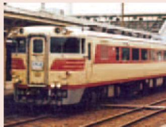
国鉄の特急くろしお