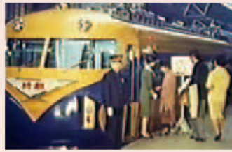
名阪特急に使われたビスタカー(10100系)の映像(「伸びゆく近鉄」より)