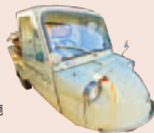
ダイハツミゼット(伊勢のりもの博物館所蔵)