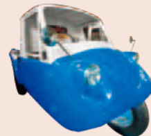
マツダK360(伊勢のりもの博物館所蔵)