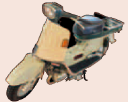
ホンダジュノ(Honda Cars 津所蔵)