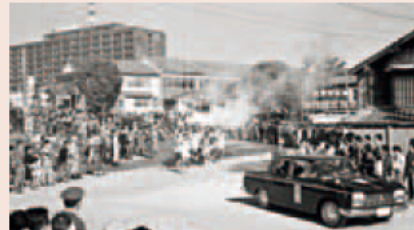
三重県庁を出発したオリンピック聖火リレーの写真