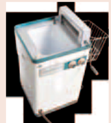
当時普及した電気洗濯機(当館所蔵)

当時活躍した三重県出身の建築家東畑謙三や、なつかしの建物、環境に関する展示、当館が収集した県内各地の風景写真も紹介。